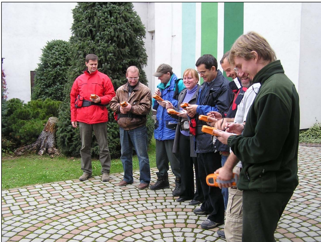
Školenie pracovníkov v roku 2008

Tento projekt je spolufinancovaný z Európskeho fondu pre regionálny rozvoj